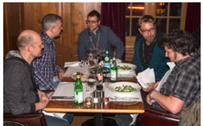
Essen: munteres Beisammensein und interessante Gespräche unter Gleichgesinnten bei feinstem Speis und Trank.